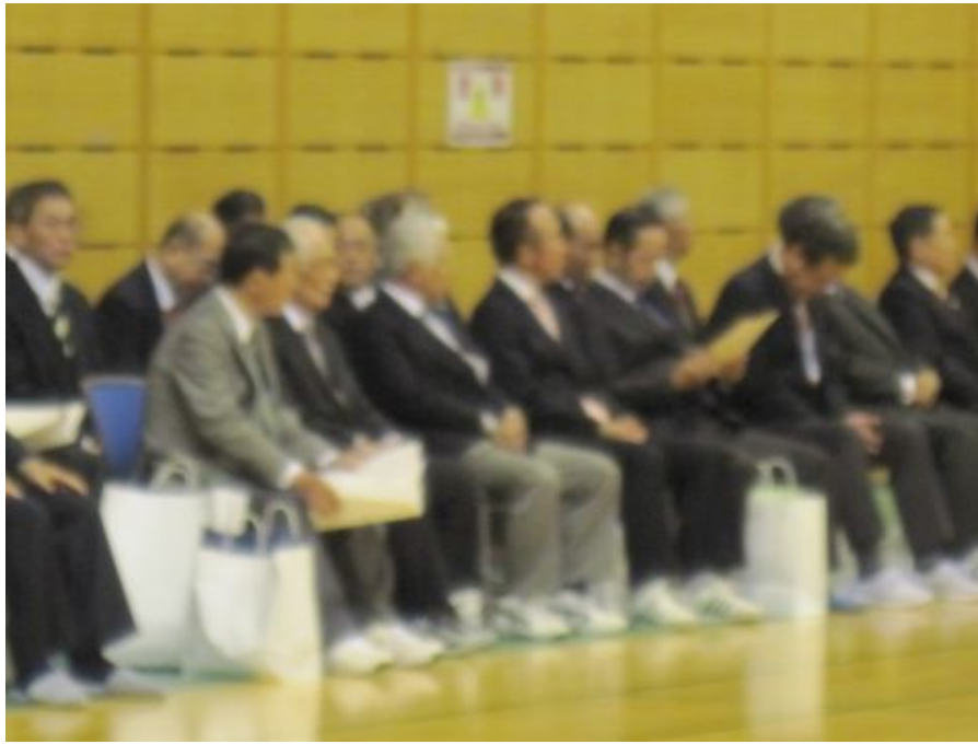
綱 引 き 風 景